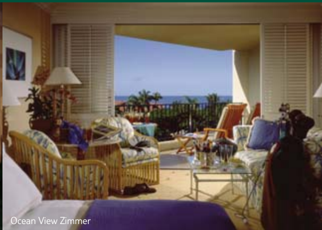
Ocean View Zimmer